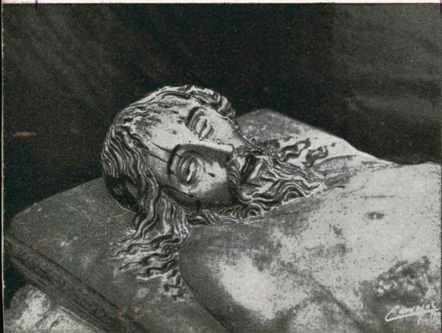
CRISTO YACENTE (Detalle)