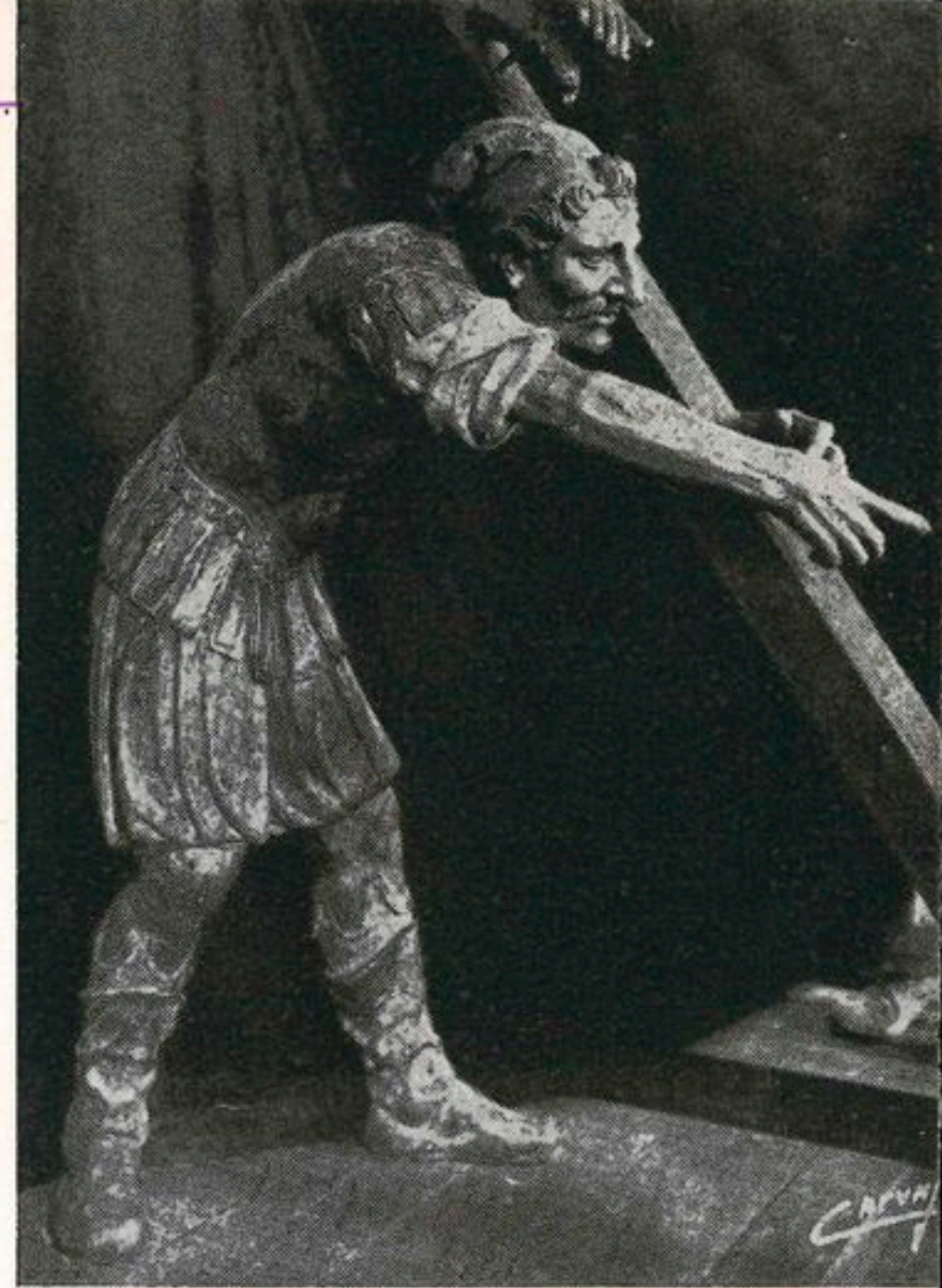
ELEVACIÓN DE LA CRUZ (Detalle)

A las seis en punto de la tarde, saldrá de la Iglesia Parroquial de Santa María Magdalena, la restaurada procesión de Caridad y Penitencia, a la que asistirán los Ilustres Colegios de Mé-