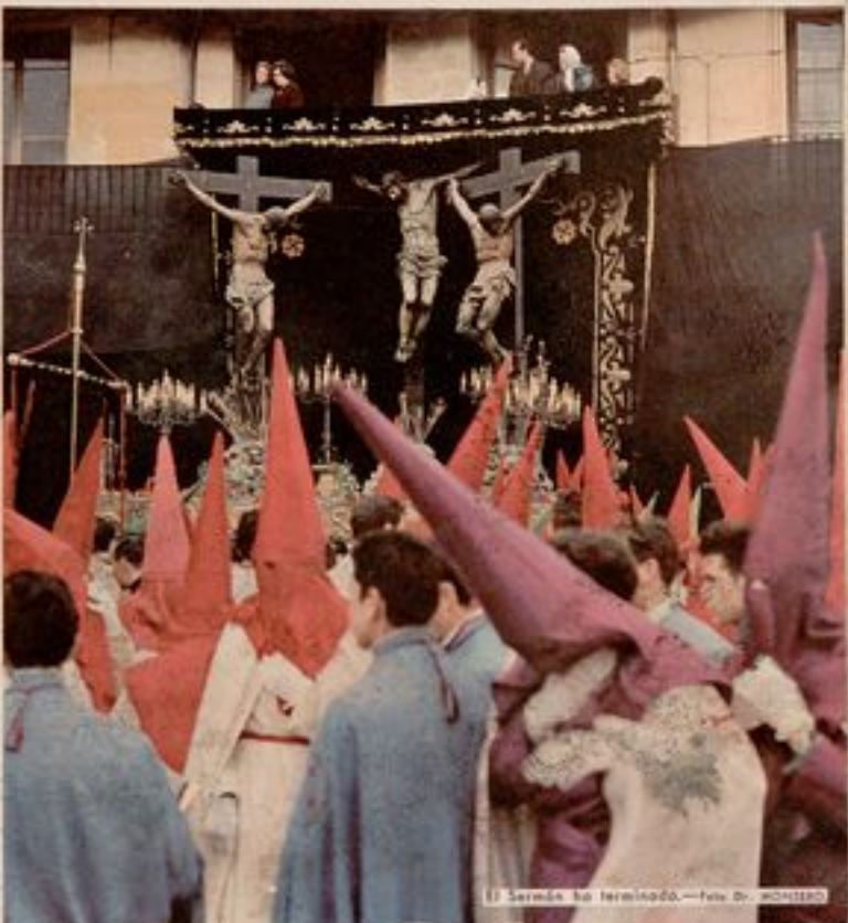
El Sermon de los Siete Palabras