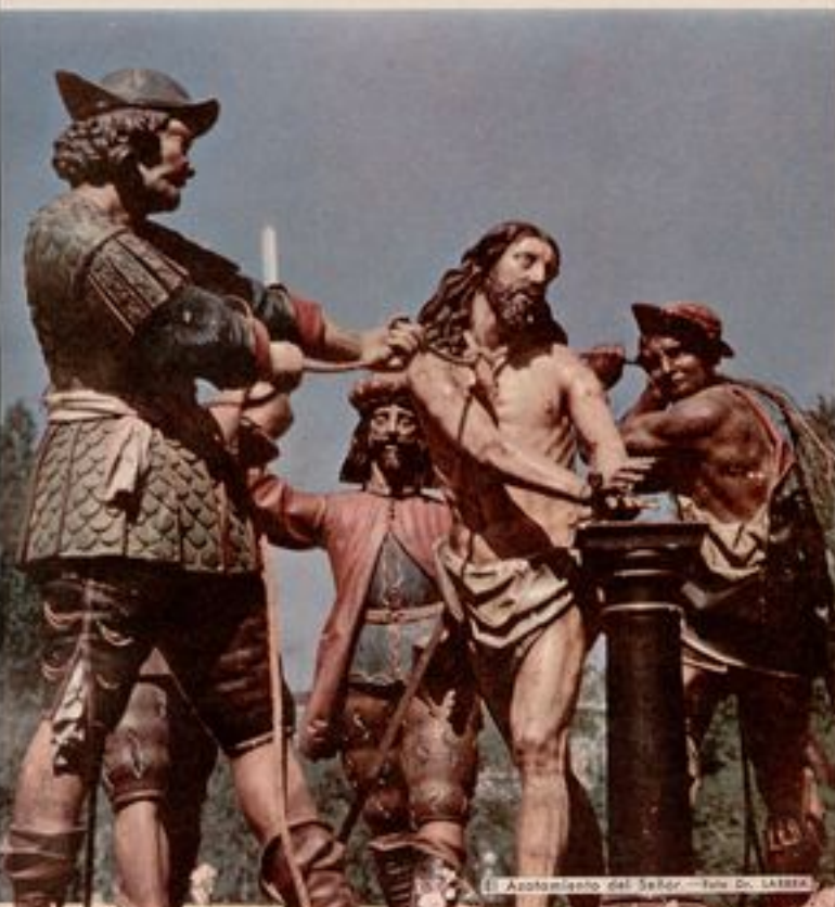
Apotemniento del Señor