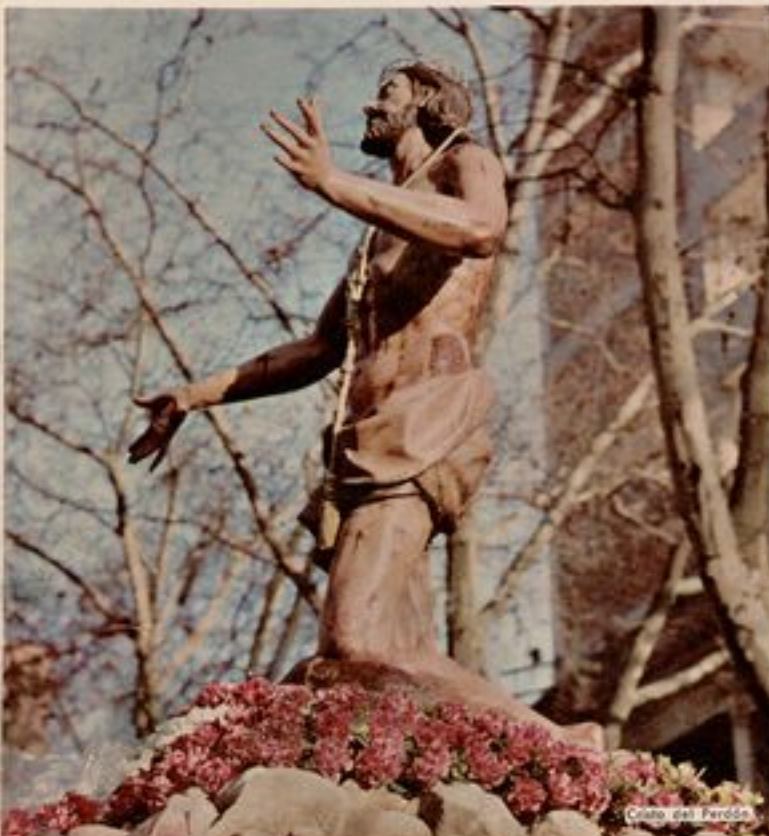
Christo del Perdón