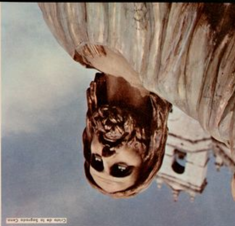
Virgo con el Niño Jesús