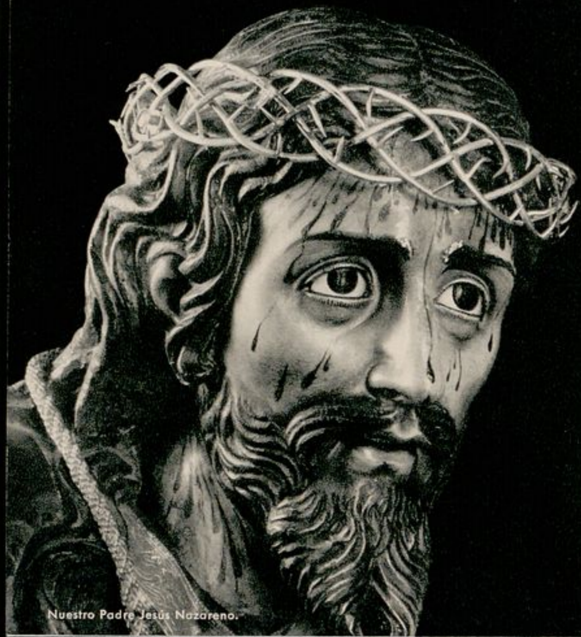
Nuestro Padre Jesús Nazareno.