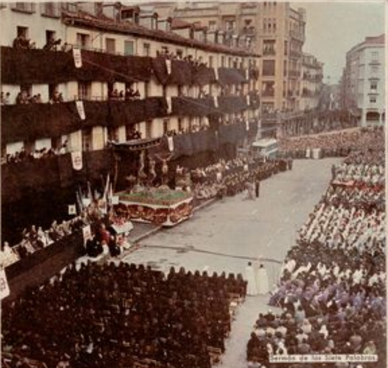
Sermon de los Siete Palabras