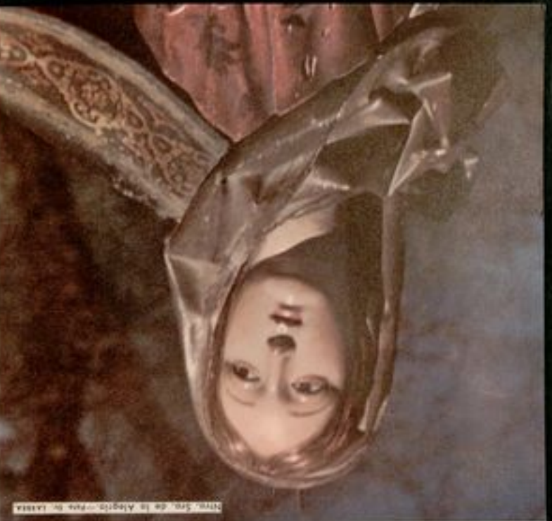
Virgo con el Niño Jesús