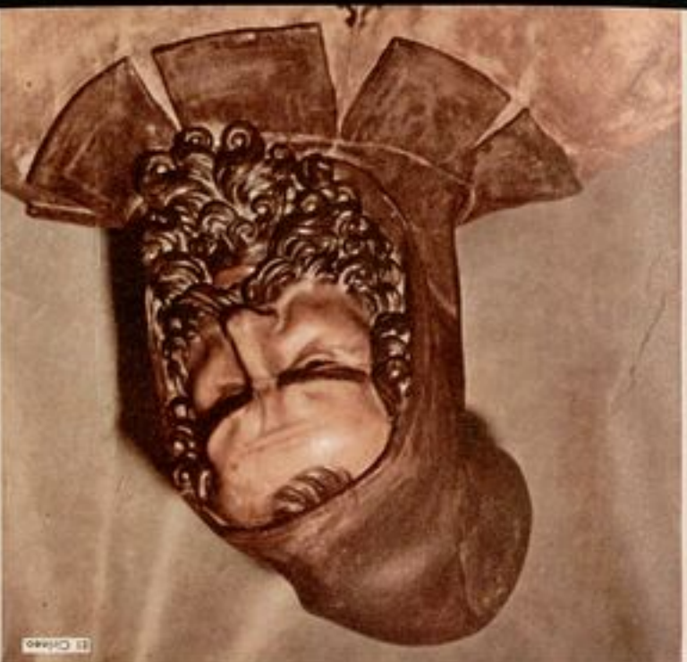
El Niño Jesús