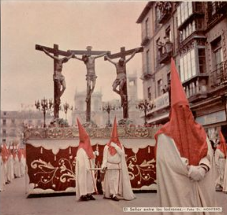
El Señor entre los Intronas