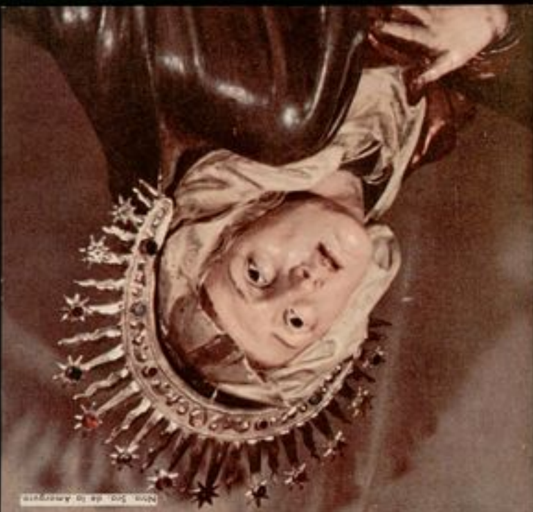
Virgo con el Niño Jesús