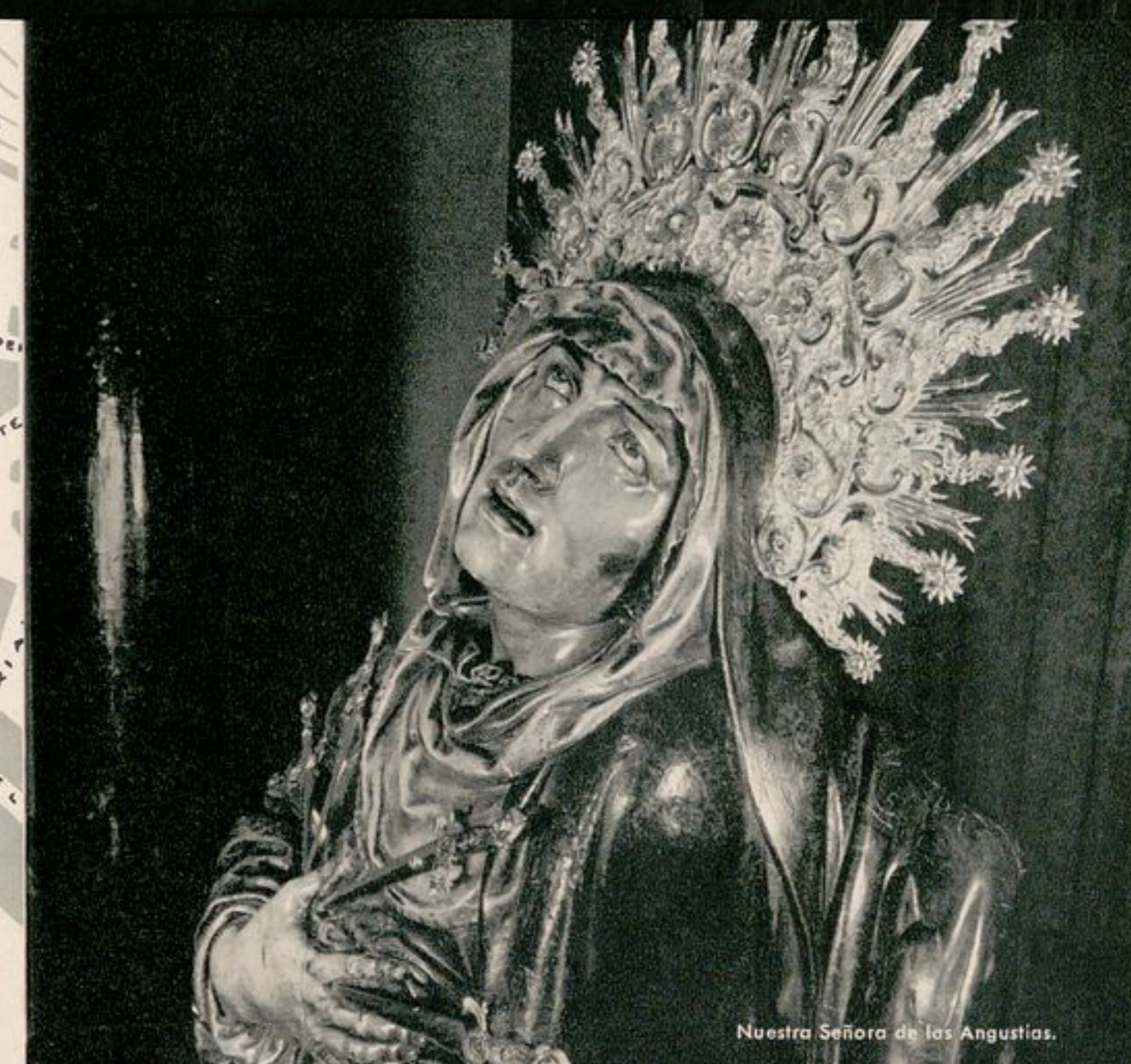
Nuestra Señora de las Angustias.