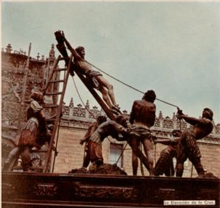
La Elevación de la Cruz