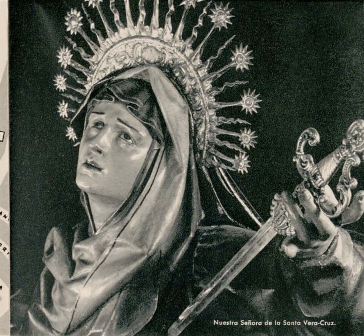
Nuestra Señora de la Santa Vera-Cruz.