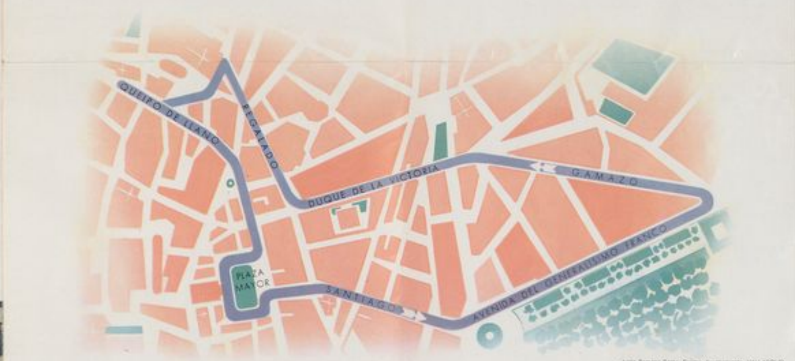
Junta Semana Santa. Excmo. Ayuntamiento. VALLADOLID