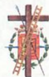
Junta de Cofradías de Semana Santa