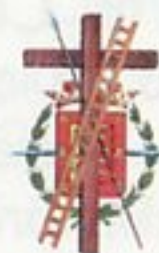
Junta de Cofradías de Semana Santa