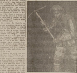
En uno de los pueblos sin... Alma y pueblos sin tragedia ni retorcimiento...