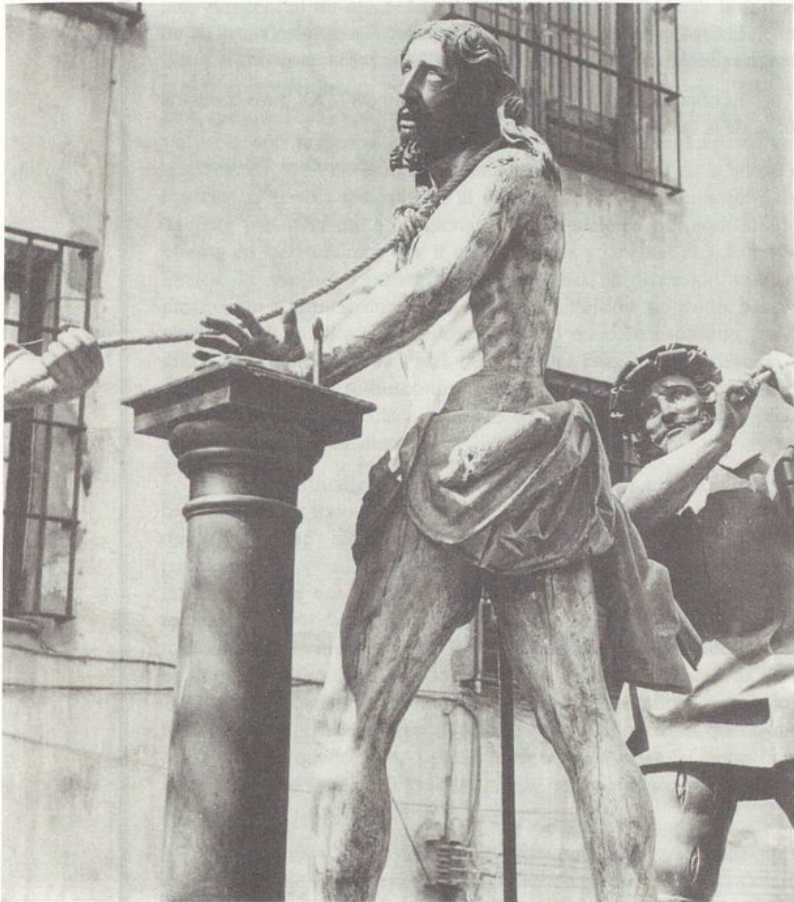
CRISTO DE LA FLAGELACION

La talla de Cristo, vivo, está en actitud de hablar a María mientras S. Juan y la Magdalena se muestran afectados por la escena. Hay que suponer que el grupo representa el único momento conocido en que Jesús se dirige, desde la Cruz, a María, cuando le dice "Madre, ahí tienes a tu hijo"; a esta relación entre la Virgen y S. Juan debe aludir el nombre con que se llamó este paso en la documentación antigua. Este grupo tallado antes de 1661, es obra de un seguidor de Gregorio Fernández, formando un conjunto muy interesante, que debía ser ciertamente impresionante si se conservaran los tres sayones que faltan.