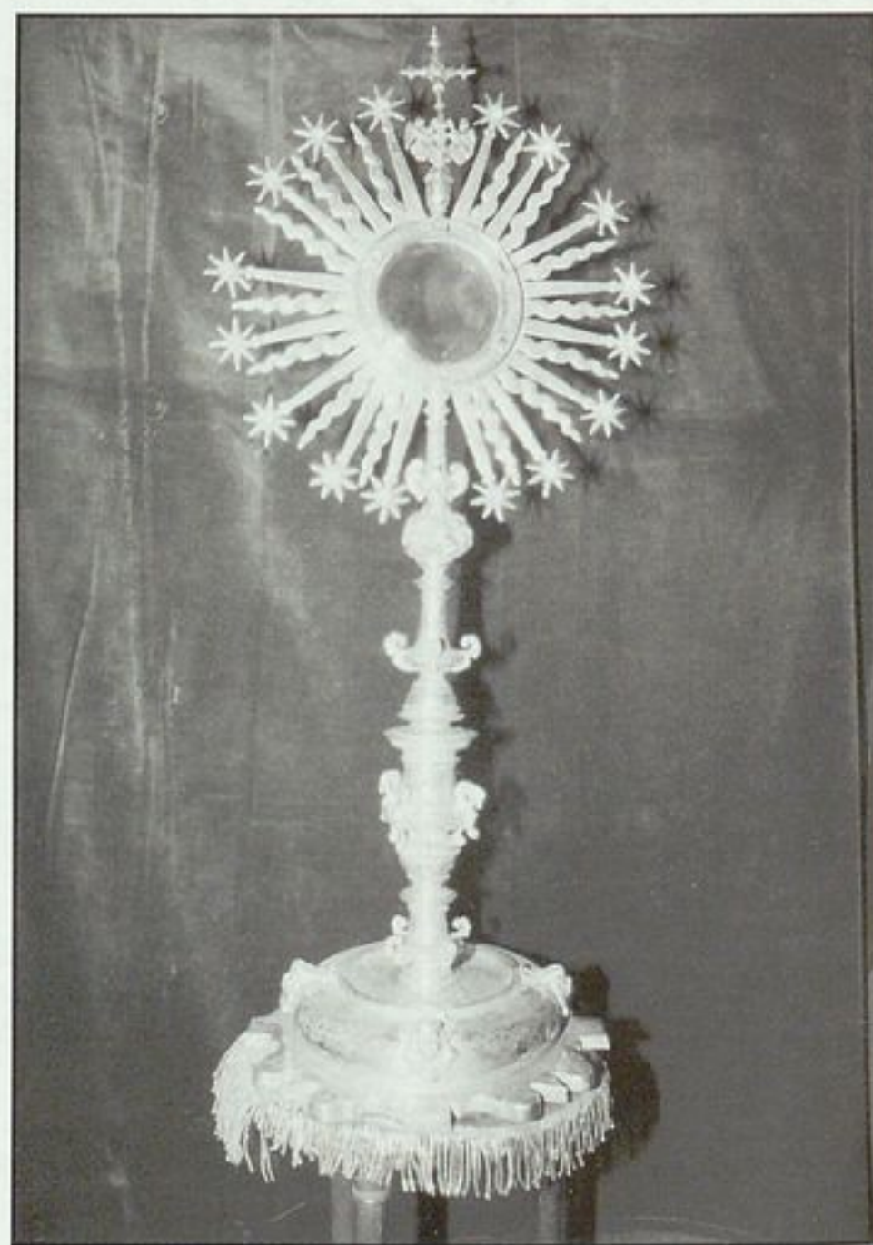
Custodia de plata de 1705

En la sociedad sacralizada y festiva del Antiguo Régimen, la Cofradía de la Vera-Cruz participaba asiduamente en los gozos y penas de sus conciudadanos: su presencia en las procesiones