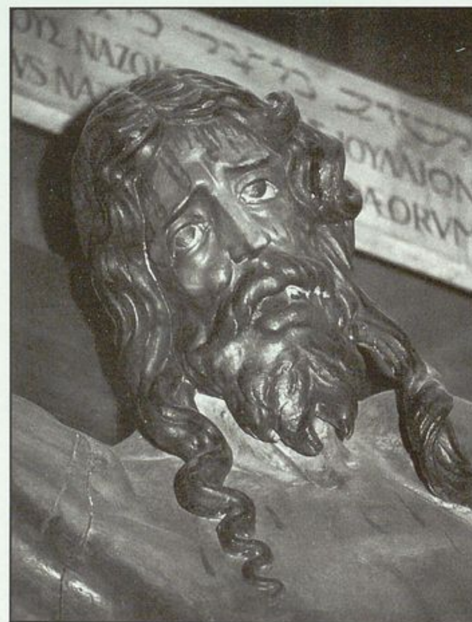
Cristo del Humilladero (Anónimo, primera mitad del siglo XVI)

y festejos generales y en los organizados por otras Cofradías e instituciones era constante; ella misma contagiaba su alegría a la ciudad con las celebraciones religiosas y profanas del 3 de mayo, y se apresuraba a sacar en rogativa su venerada imagen de Cristo —hoy llamado Cristo del Humilladero— cuando la ciudad se veía asolada por alguna calamidad (puede verse, por ejemplo, el relato de las rogativas que se realizaron en 1753 y 1774, con motivo de sendas sequías, en el Diario de Valladolid de Ventura Pérez).