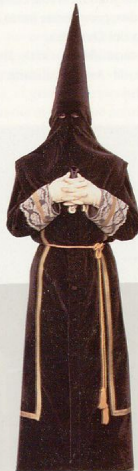
Cofradía Penitencial de Nuestro Padre Jesús Nazareno. Iglesia de Jesús. Calle de Jesús 47001 Valladolid