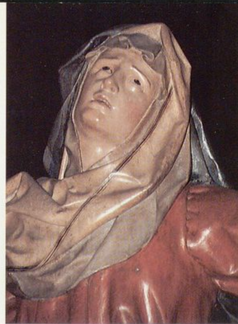
■ Los pasos de la Vera Cruz son de estilo barroco de la escuela castellana