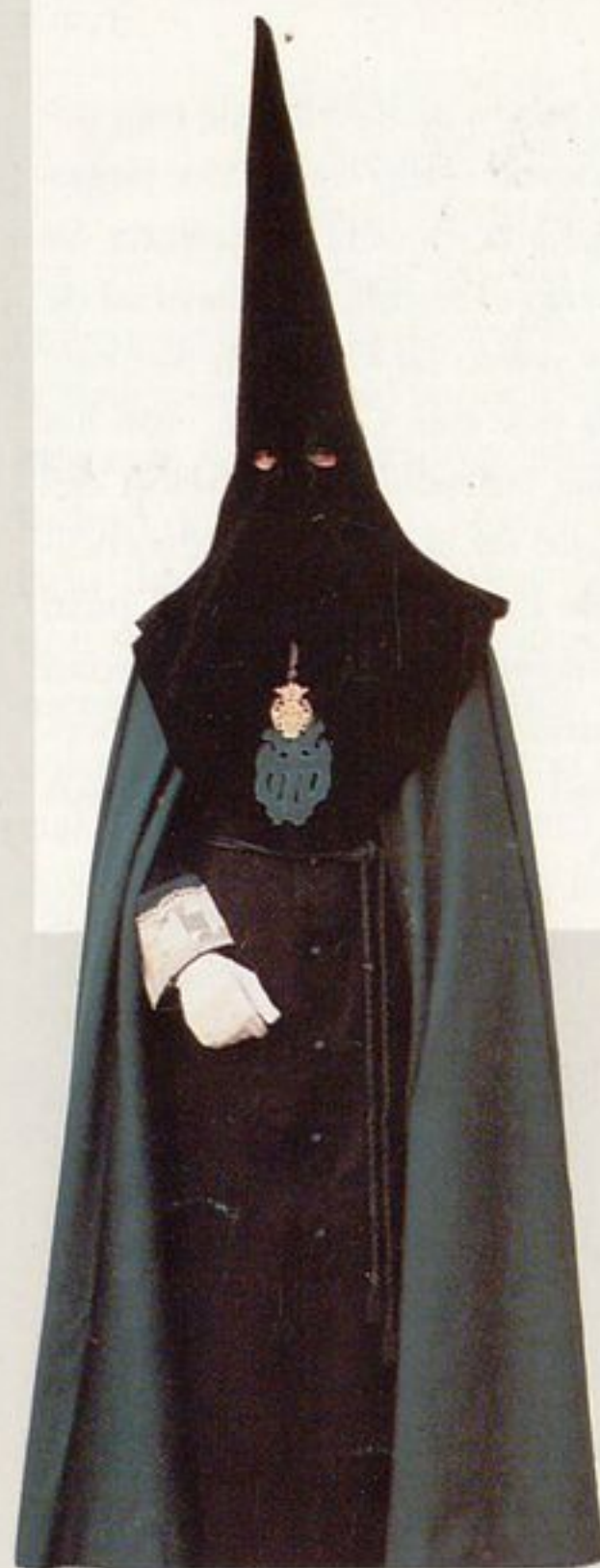
Cofradía La Santa Vera Cruz c/ Rúa Oscura, 1. 47003 Valladolid