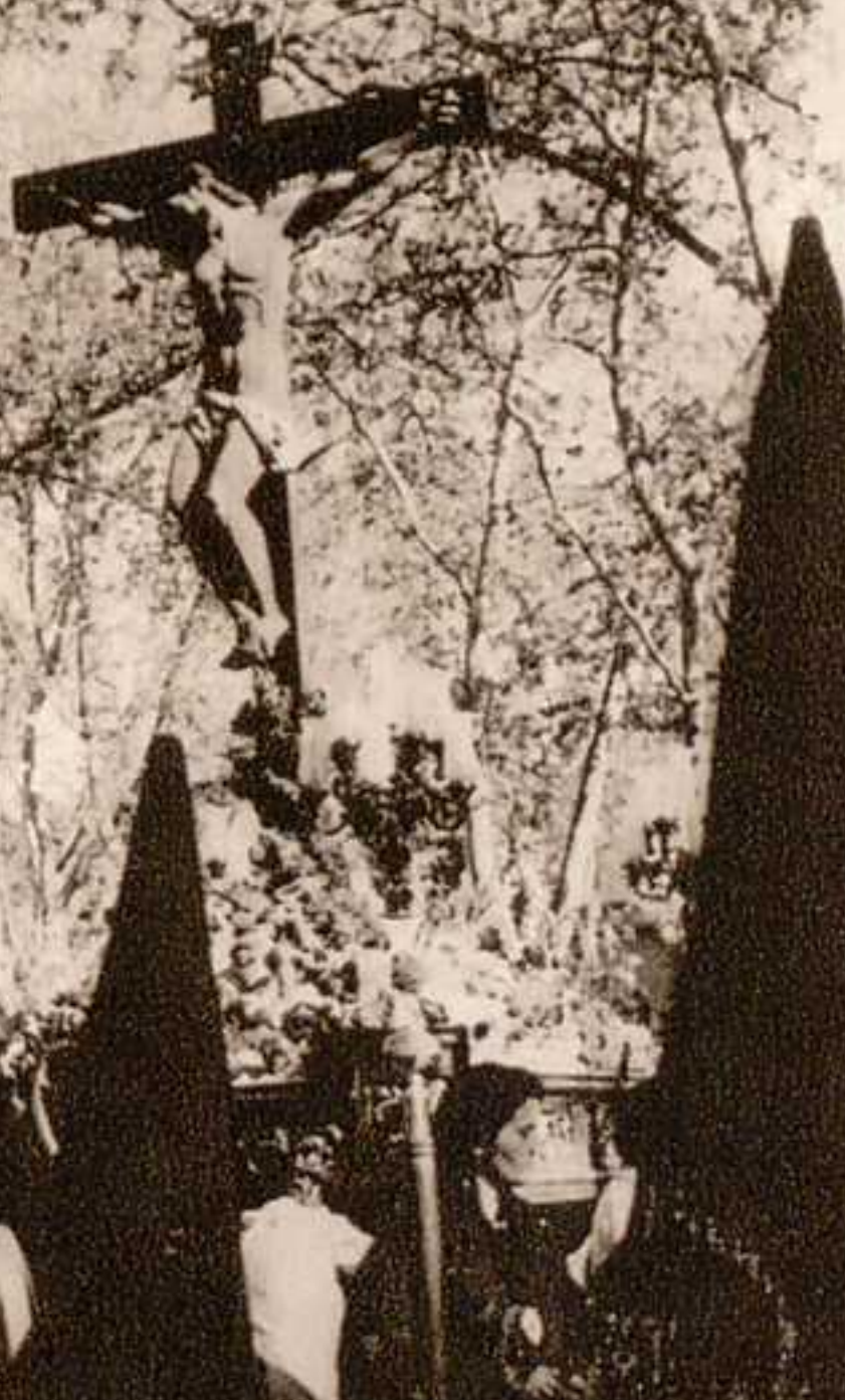
Cristo en la Cruz.