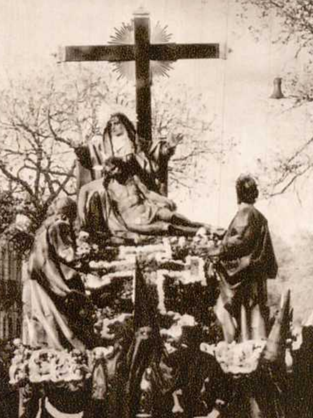
La Quinta Angustia.