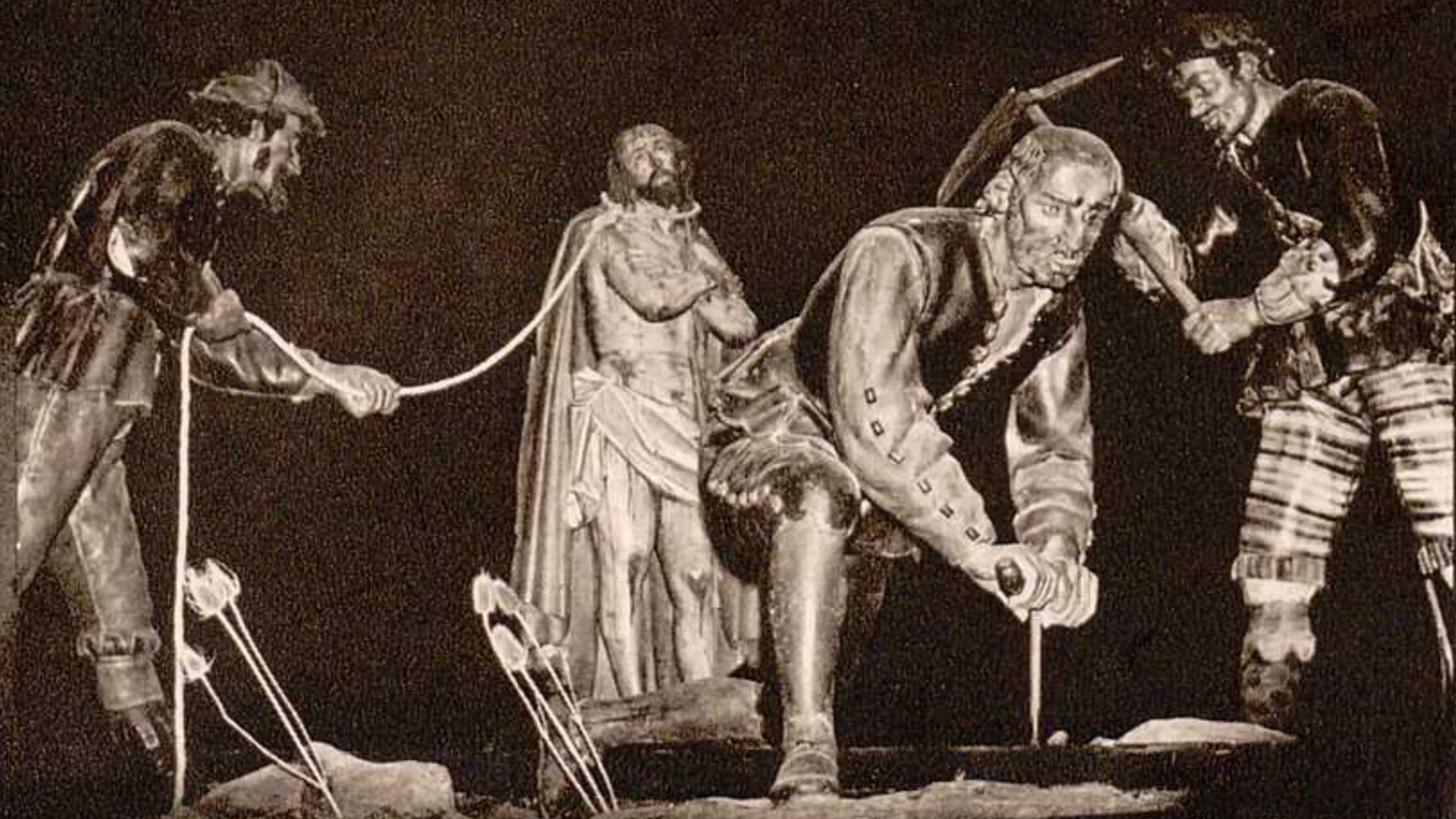
Preparativos para la Crucifixión.