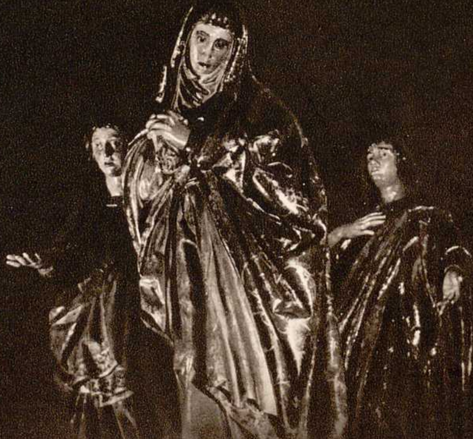
La Virgen y San Juan.